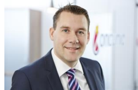
Dipl.-Betriebswirt (FH) Steuerberater Prokurist